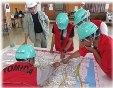
地域内の危険個所の確認

災害が発生した時やその恐れがある時には、連合自治会と連合自主防災隊で構成される災害対策本部が市民センター2F ホールに開設されます。ここでは被害状況の把握・市等の関係機関への救助要請などを行います。無線機の操作はまずは慣れることが必要。携帯電話との違いから戸惑う参加者が見受けられました。地域の行事でも是非活用して操作を体感してください。