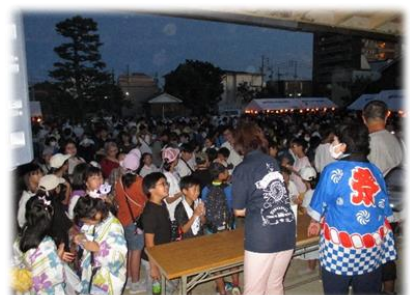
笑顔と歓声の富田くじ