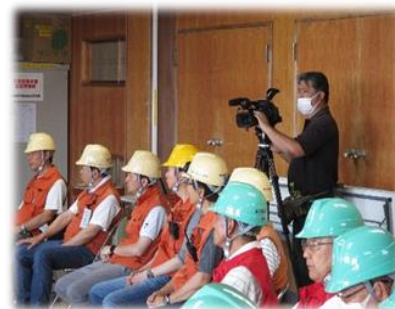
ケーブル局CTYでも放送