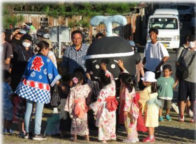
ちびっこに大人気のくうちゃん

7/29（土）に中公園で開催され大勢の来場者で大盛況！ ミニ石取山車、ミニ鯨船、輪投げ、くじ引き、各種屋台などが出店して富田っ子の夏の思い出となりました。