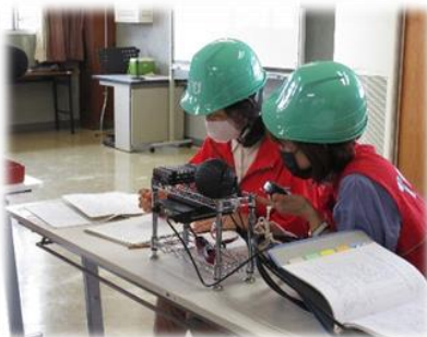
無線機による通話訓練