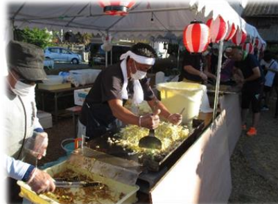
焼きそばの行列は100人越え