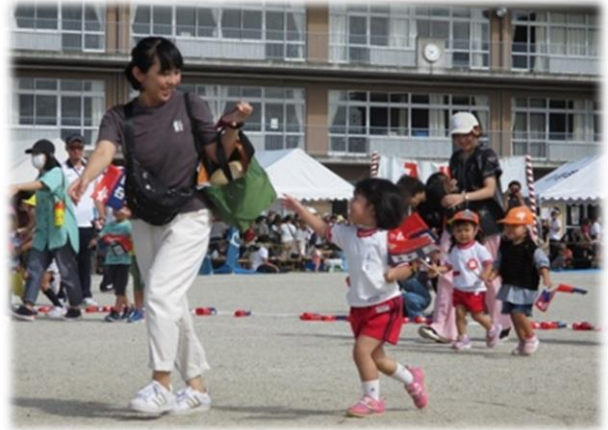
お母さんまって～ わたしも旗とれたよ～