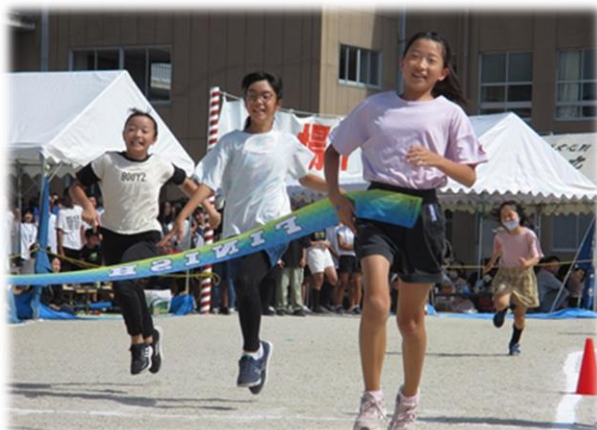
1等賞でなくてもみんな笑顔だよ(徒競走にて)