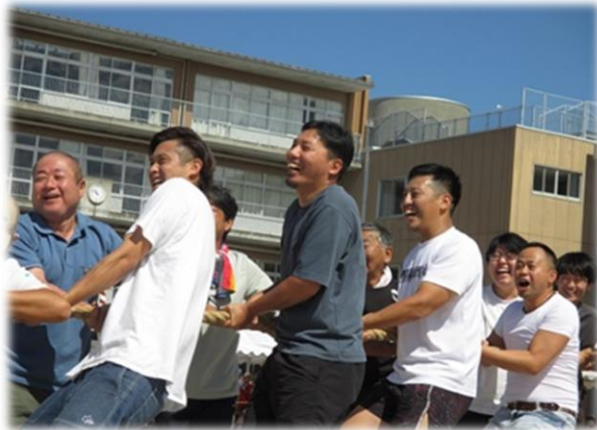
綱引きのために鍛えた(!?)マッチョなお兄さん達

体育委員、まちづくり協議会、自治会、消防団など各団体の皆さんは2か月以上前から開催準備から後片付けまでお世話をかけましたが、来場者のあふれる笑顔で十分に報われたのではないのでしょうか。本当にお疲れ様でした。ということで、今回は笑顔がいっぱいの写真を集めてみました。