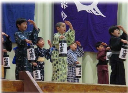
文化幼稚園の年長の皆さん