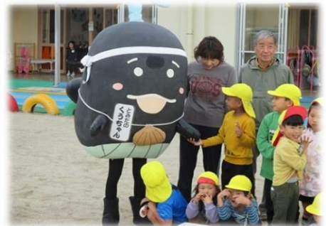
視線はくうちゃんへ カメラを見てよ