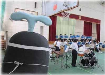
富田中の演奏に酔いしれる くうちゃん