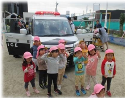
パトカーにも乗ったよ