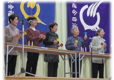
歌おう会のメロディベル

マネージャーのひとり言 ~~~~ 今年も地元中日ドラゴンズを応援しました。思い起こせば私の応援するものは弱いものばかり。お相撲さんに、プロゴルファーに、ほかにも……。応援される側からすれば迷惑な話で、応援しないでくれと言われそう。デキのわるい子ほどかわいいといった心境か、屈折した愛情か。野球がシーズンオフになるこれからの時期のスポーツ新聞は夢と希望があってけっこう楽しいもの。これから春まで夢を見させてくださいな。