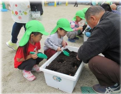
何色の花が咲くのかな

青少年を守る部会によるチューリップの球根植えを行いました。園内の花壇とプランターにひとり2個ずつの球根を丁寧に植えました。春が楽しみだね。11/22には富田文化幼稚園でも行います。その様子は次号のくうちゃんだよりでね。