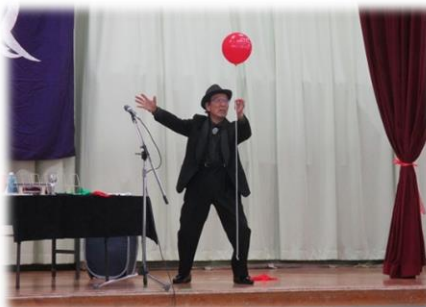
KAZUさんのほのぼのマジック