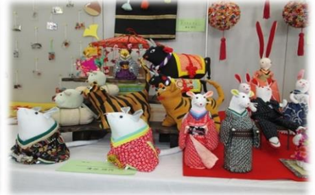
かわいらしい手作り置物