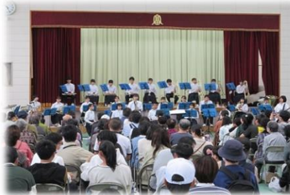
200人の聴衆を前にして