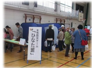
女性防災チーム「ひなた班」

朝9時に防災サイレンが鳴り響き、南海トラフ地震発生との想定で訓練を行いました。中心となった会場は富田小学校。本物の消火器を使って消火体験、放水体験、介助体験などの体験ができました。1,500人以上もの富田っ子が参加して防災と減災の知識が高まる日になりました。