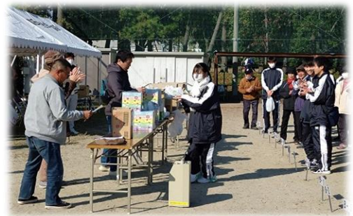
表彰式の様子 みんながんばったね