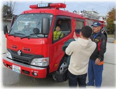
くうちゃんも乗ってみたいな