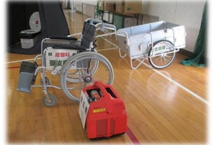
防災用品展示コーナー