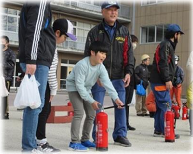
初めての消火器、狙いを定めて