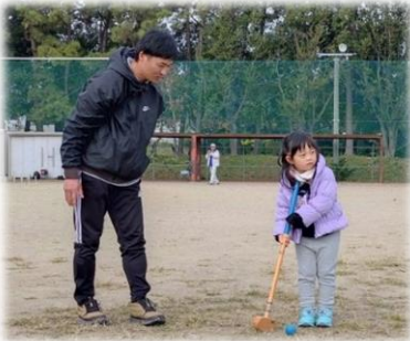
くうちゃんと一緒にだね↓