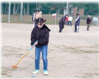
ねらって、ねらってー