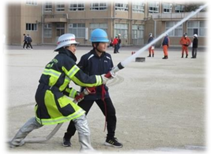
こんなに放水って飛ぶものなの？

朝9時に防災サイレンが鳴り響き、南海トラフ地震発生との想定で訓練を行いました。中心となった会場は富田小学校。本物の消火器を使って消火体験、放水体験、介助体験などの体験ができました。1,500人以上もの富田っ子が参加して防災と減災の知識が高まる日になりました。