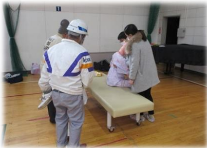
「四季の郷」による介助体験