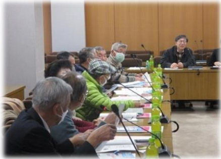
活発な質問・意見が出された説明会

視察の目的地は、スマホを使った電子回覧板を先駆けて導入している愛知県豊川市。通常は紙のものを回している回覧板を、スマホを使って一括配信するという取り組みを視察しました。スピードの面で優れているなど導入するメリットは確かにありますが、閲覧率が伸びないなど多くの課題があることを実感しました。視察後は短い時間でしたが幾つかの観光地を巡って楽しい一日となりました。旅行委員の皆様と参加者の皆様、お疲れさまでした。