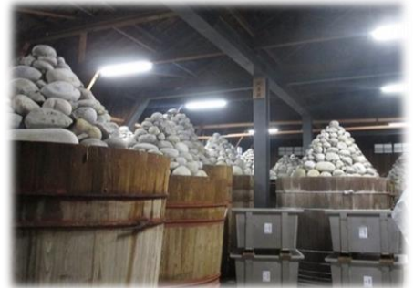
岡崎ではみそ蔵を見学しました