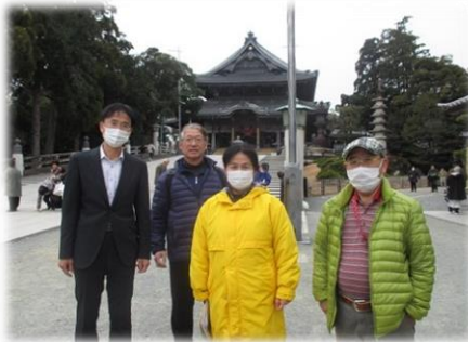
豊川稲荷のガイドさんと共に