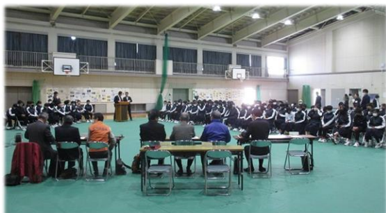
富田中学校の体育館が会場でした

この催しは、中学生と地域のまちづくりを中心となって活動している人々とが、年に1回学びあう機会です。富田中2年生の3つのグループが発表をしてくれました。テーマは「環境とSDGs」「安全と防災」「歴史と祭り」でした。参加者の皆様、お疲れ様でした。