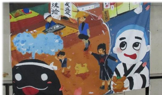
くうちゃんの絵がスクリーンに。ありがとう！