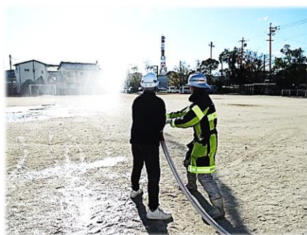
一度は経験、大迫力の放水訓練