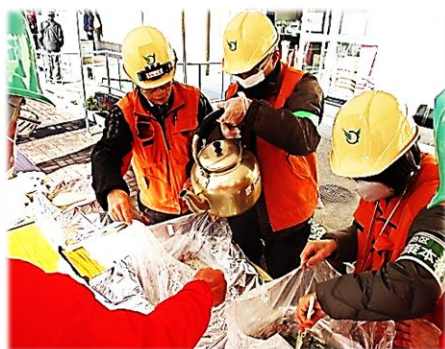
お湯を注ぐだけでわかめごはんが

今回特に感じたのは災害時のトイレの備えの大切さです。多くの方が発災から3時間以内にトイレに行きたくなったといいます。食事は半日以上ガマンできても排泄は待たなし。大災害が発生するとトイレに汚物があふれてしまうのが現実です。排泄物を凝固剤や吸収シートで固めて、燃えるゴミで処分できる携帯トイレの準備をしておきましょう。できれば7日分を平時から備えておくと安心です。