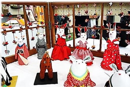
ねずみとウサギのダンスだよ

これまで別々に開催していた文化祭と敬老会を今年は同日に開催。その分、会場の富田小の体育館はこれまで以上にぎやかでした。文化祭の展示ブースも活気がありました。