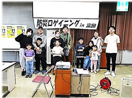
ファミリーの部 入賞者の皆さん