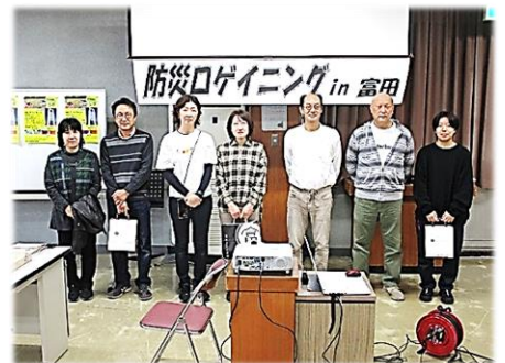
一般の部 入賞者の皆さん