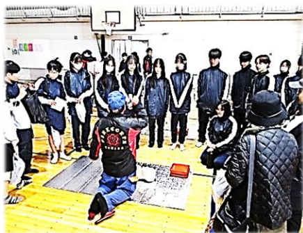
熱い説明に聞き入る富中生

午前9時に大地震が発生し大津波警報が発表されたという想定で訓練が始まりました。今年には178名の富田中学の生徒の皆さんも日曜授業として参加してくれました。訓練内容は応急処置体験、初期消火や放水消火訓練、煙体験、非常食試食など、まさに総合的な訓練でした。参加された約700名の皆さん、お疲れ様でした。