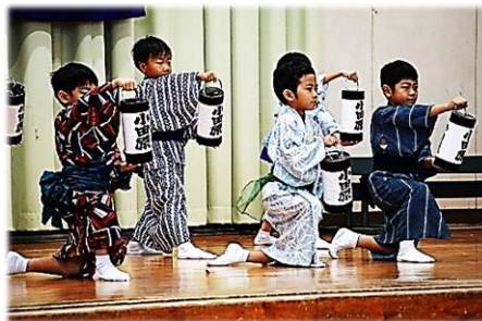
おさるのかごや カッチョいい！