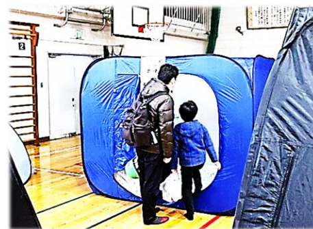
テントは貴重なプライベート空間

今回特に感じたのは災害時のトイレの備えの大切さです。多くの方が発災から3時間以内にトイレに行きたくなったといいます。食事は半日以上ガマンできても排泄は待たなし。大災害が発生するとトイレに汚物があふれてしまうのが現実です。排泄物を凝固剤や吸収シートで固めて、燃えるゴミで処分できる携帯トイレの準備をしておきましょう。できれば7日分を平時から備えておくと安心です。