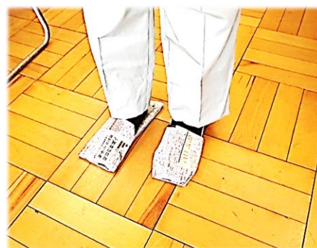
新聞紙でスリッパを作りました

●マネージャーのひとり言 …………… 早いものであつという間に年末です。歳を重ねると益々1年が短く感じますね。これにも理屈があるようで。10歳には1年は人生の1/10だけど50歳には1/50だから5倍速く感じるとか。はたまた新しい経験がだんだんと減ってくるからだとかね。1年を長く濃密に感じるには、いくつになっても新しい趣味・人とのつながり・学びにチャレンジするといいのかも。さて富田の皆さん、良いお年をお迎えくださいませ。 🙌 🙌 🙌