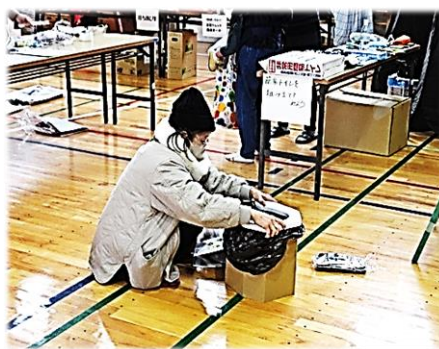
段ボールでトイレを作ってみよう