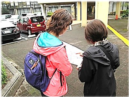
地図を見て次はどこへ？

ロゲイニングをご存じですか？ 地図を頼りに数多くのチェックポイントを制限時間内に巡って得た点数を競う野外スポーツです。今回は富田地区にある防災に関する地点を主なチェックポイントにして開催しました。富田地区では初めての開催でしたが「新しい発見があって楽しかった！」「また参加したい！」など嬉しい声がぞっくぞっく。またやりますよ！