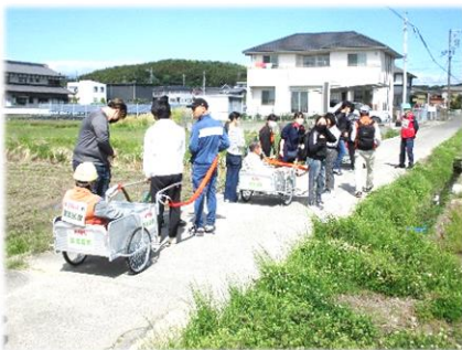
高校生が要支援者を運びます

この訓練は自力で避難ができなくて支援が必要な人をリヤカーや車椅子で高台まで運ぶ訓練です。昨年にも防災まちづくり大賞の内閣総理大臣賞を受賞し高い評価を受けました。今年は5月1日(木)に訓練を行う予定です。チラシなどで事前にお知らせしますので一度訓練に参加してみてくださいね。下の画像は昨年の訓練の様子です。