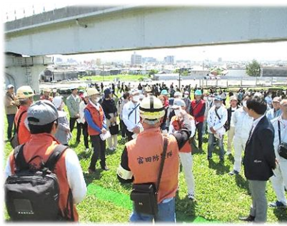
くるべ古代歴史公園に着きました