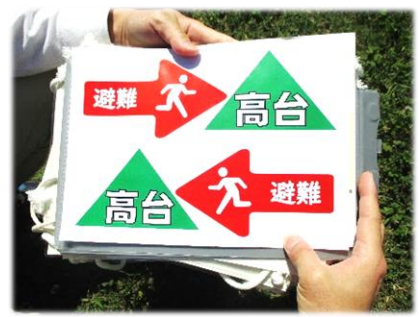
避難方向を示す命の矢印カード