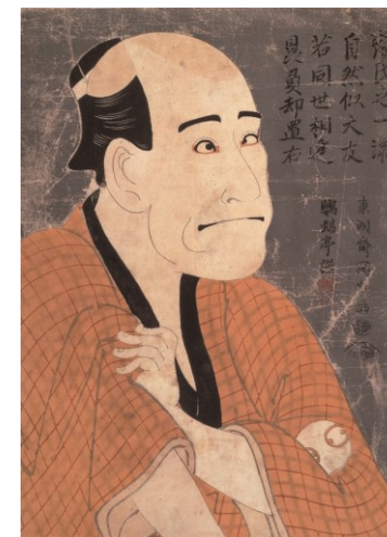
上: 東洲斎写楽 《二代目嵐龍蔵の金貨石部金吉》 寛政六年(1794) 豎大判錦絵

写楽の役者絵や歌麿の美人画、北斎や広重の名所風景画、国芳の風刺賀などバラエティに富んだ人気浮世絵師住人の作品160点余りを一堂に展示します。また版画のイメージが強い浮世絵ですが、絵師による肉筆画も展示します。版画との違いにご注目ください。 特設コーナーでは当館所蔵の浮世絵も展示しますので、あわせてご覧ください。