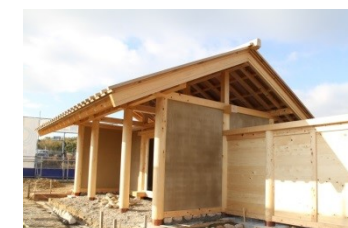
八脚門復元建築中写真