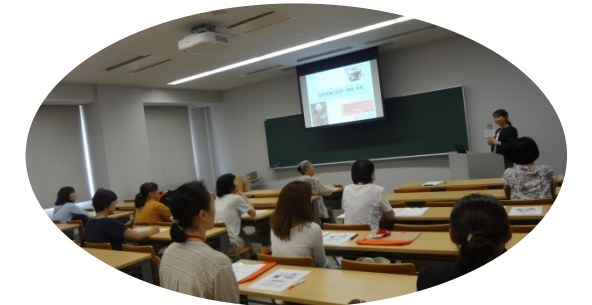
昨年度の受講風景